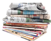
Journaux et magazines