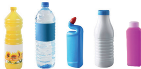
Emballages en plastique