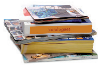
Prospectus et catalogues