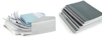
Courriers, enveloppes et autres papiers